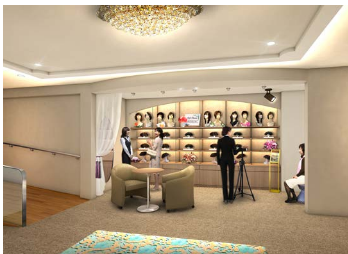
「アデランス渋谷」（イメージ図）

アデランスでは、近年ウィッグをファッションとして楽しむ女性が増加しているのを背景に、さまざまな髪型をお楽しみいただける「スタイル・ミュージアム」の導入店舗を拡大しております。今回移転リニューアルする「アデランス渋谷」は、渋谷の中心部に位置しながら、都会の喧騒とはかけ離れた上質な空間と心からのおもてなしでお客様をお迎えいたします。