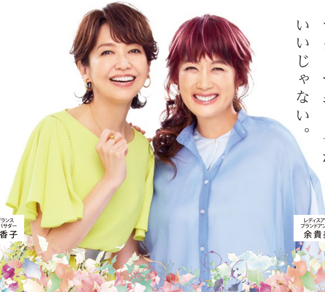
レディスアデランス ブランドアンバサダー 賀来千香子

※最終受付は、各日終了時間の1時間前まで。 ※受付時間は変更になる場合がございます。