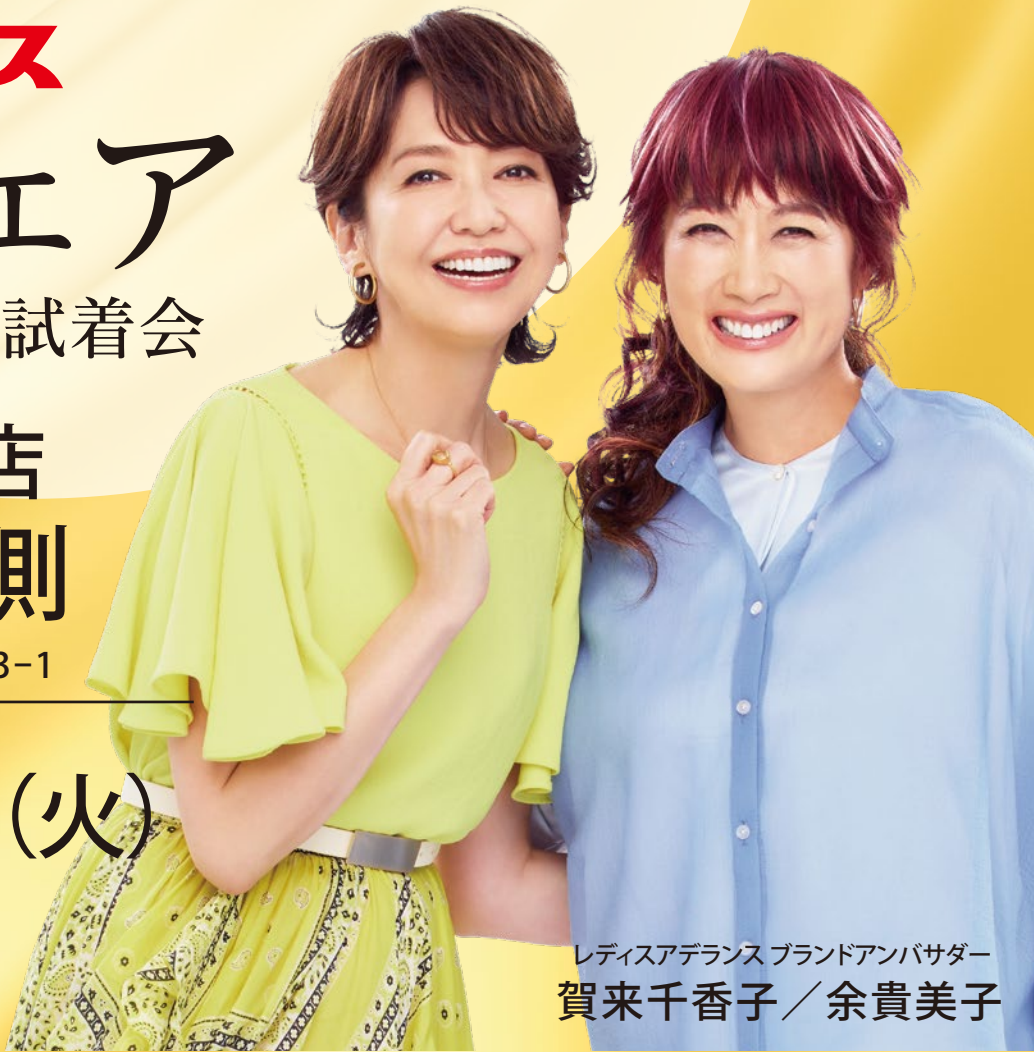
レディスアデランスブランドアンバサダー 賀来千香子 / 余貴美子