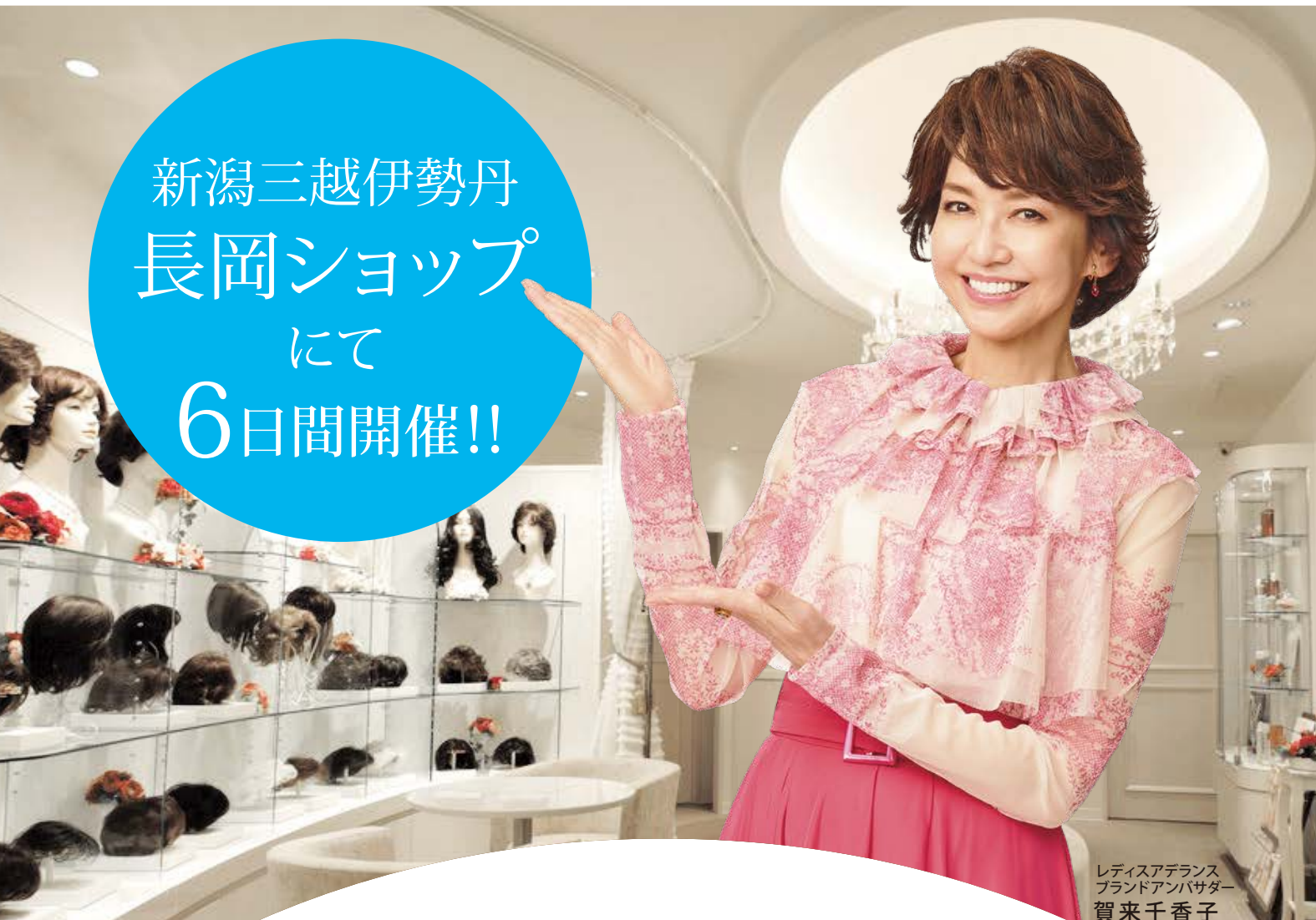
レディースアデランス ブランドアンバサダー 賀来千香子