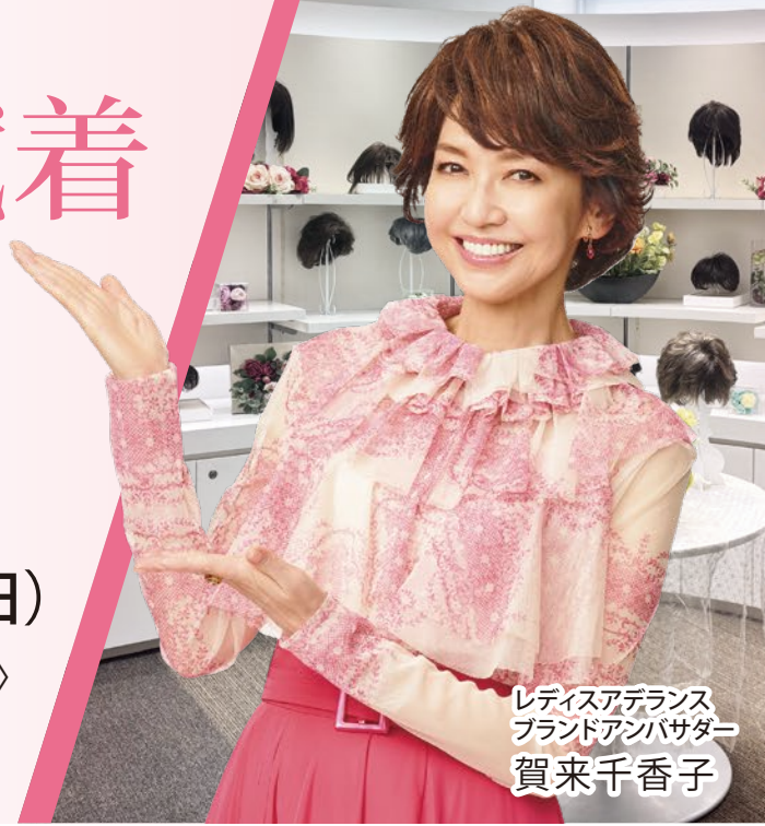
レディスアデランス ブランドアンバサダー 賀来千香子