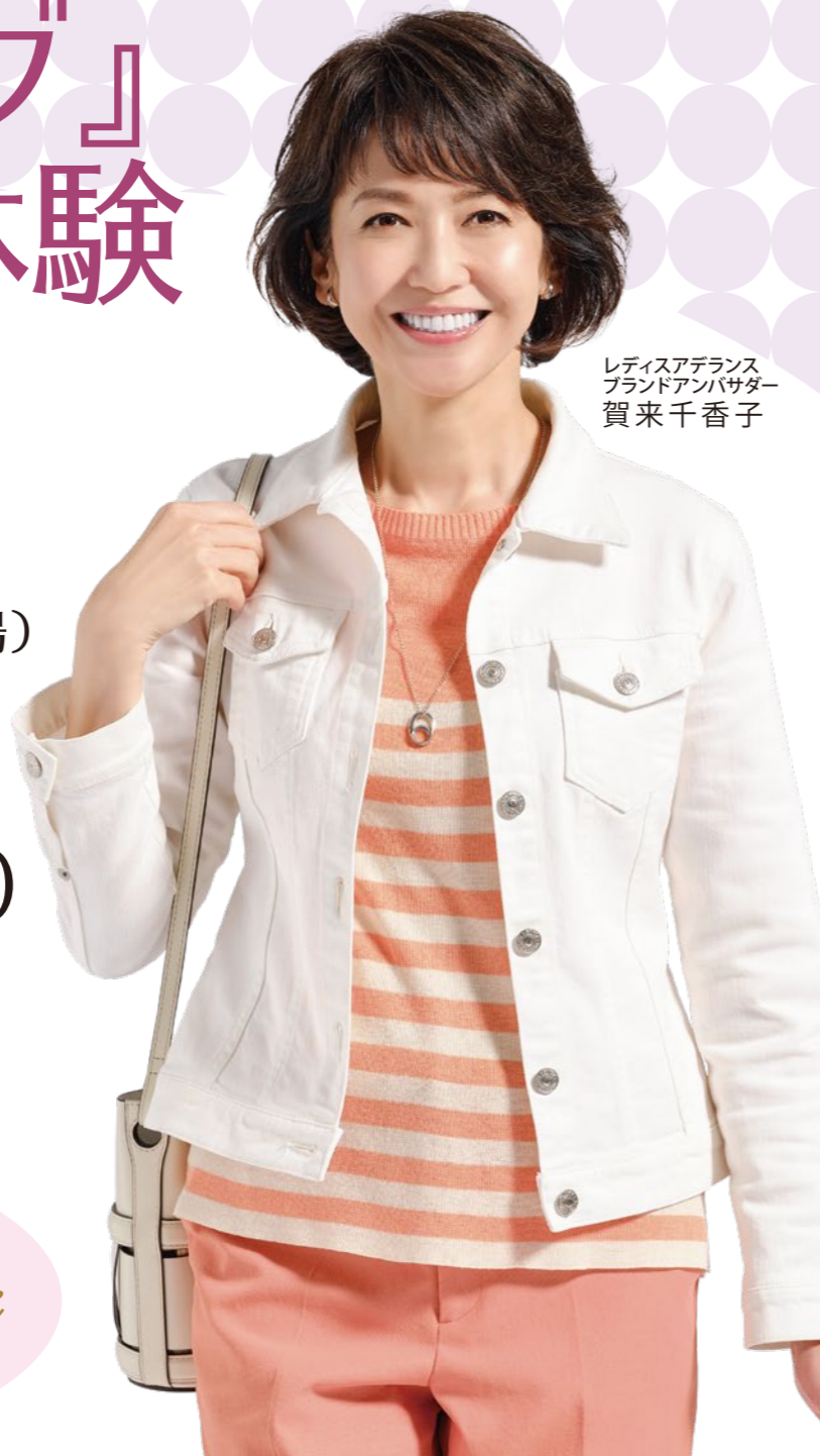
レディスアデランス ブランドアンバサダー 賀来千香子

★ご予約いただいた方へ、ベネファージュ『シャンプー&トリートメント』のお試しサンプルを差しあげます。