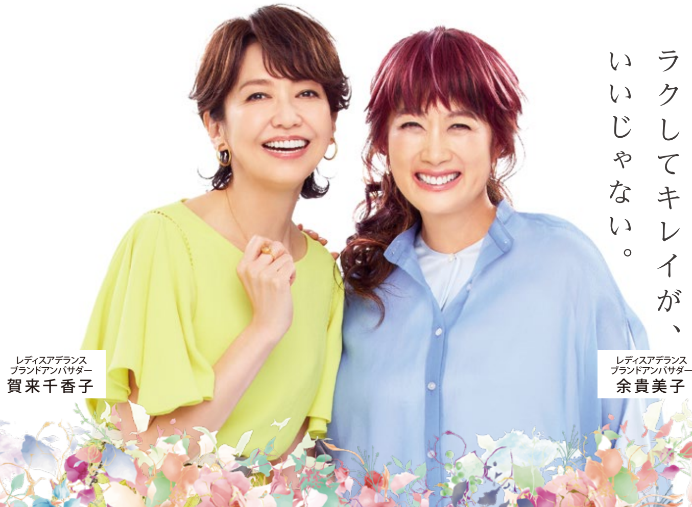
レディスアデランス ブランドアンバサダー 賀来千香子