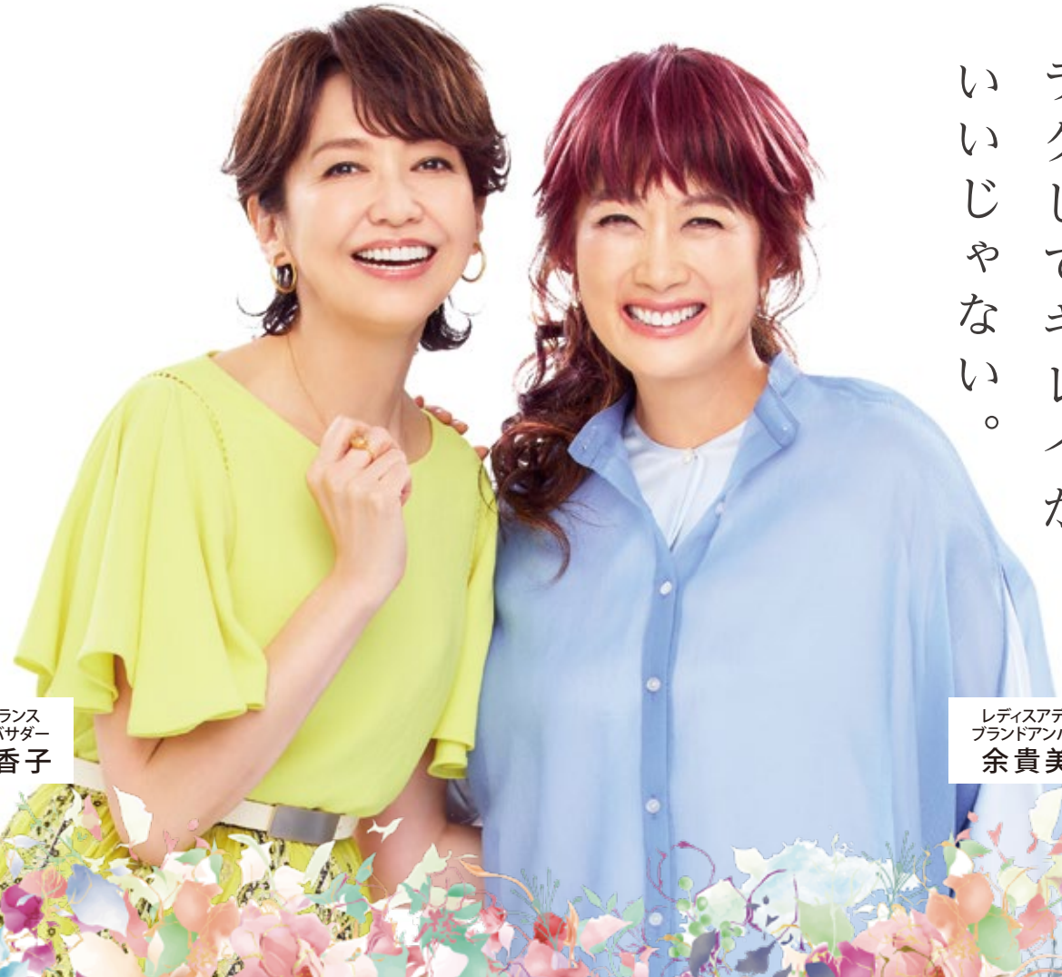
レディスアデランス ブランドアンバサダー 賀来千香子