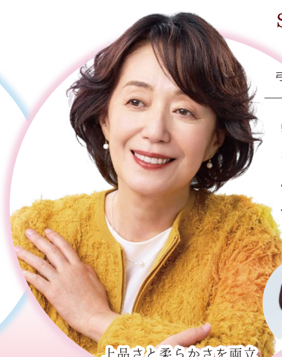
上品さと柔らかさを両立