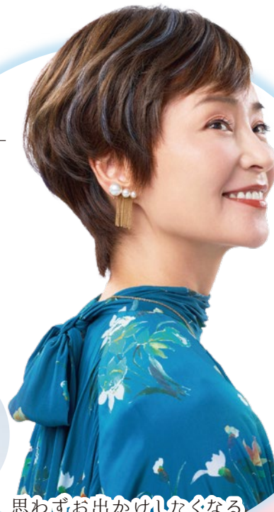
思わずお出かけしたくなる