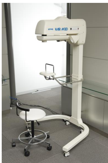
「ADERANS M3D(アデランス・エムスリーディー)」

※ 毛髪診断士とは、内閣府認定の公益社団法人「日本毛髪科学協会」が認定している資格であり、毛髪に関する専門知識と毛髪の状態を的確に観察する技術を習得し、適切なアドバイスを行うことができると認められた者に与えられます。