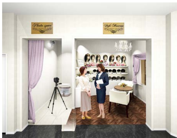
「アデランス川口」（イメージ図）

アデランスでは、近年ウィッグをファッションとして楽しむ女性が増加しているのを背景に、さまざまな髪型をお楽しみいただける「スタイル・ミュージアム」の導入店舗を拡大しております。今回「アデランス川口」が入居する「かわぐちキャスティ」は、3 階エントランス部分が JR 川口駅東口からペデストリアンデッキで直結しているため、電車をご利用される方にもアクセスが非常に便利です。