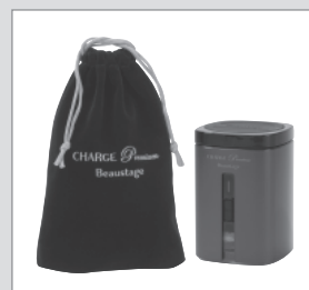
Beastage CHARGE Premium

500mlのペットボトルの水を5分で水素水に。充電式で270gと軽量なので持ち運びにも便利。64,800円