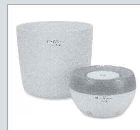
Beastage SPA Premium

お風呂に沈めて水素風呂に、付属のボウルに沈めて水素洗顔にと自宅で水素入浴が楽しめます。稼働中は青いLEDランプが発光します。1450g(本体)/81,000円