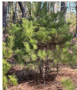
アカマツの木 ～成長の記録～