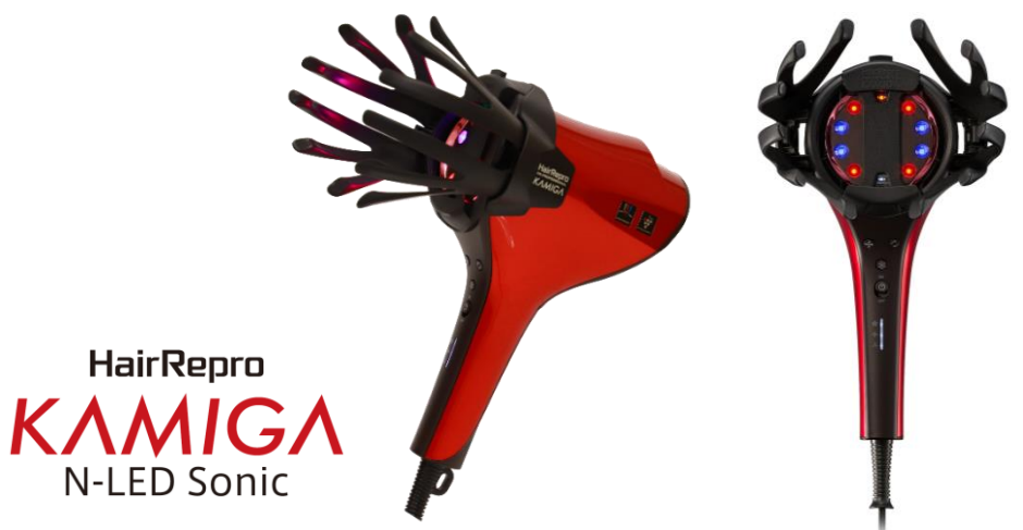
『N-LED Sonic KAMIGA』