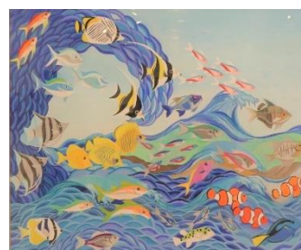
2022 パラアート TOKYO 第9回国際交流展 作品名：『なかま』 作者：大山陽菜さん