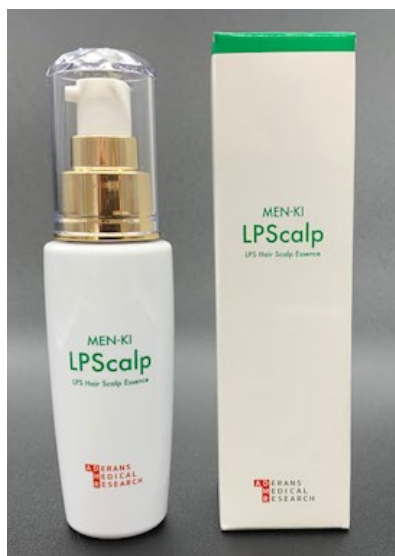
「LPS 免気 MEN-KI ヘアスカルプエッセンス」

LPS（リポポリサッカライド）※1は、自然の中の土や木、植物や食品、空気中に存在している物質で、体内で作りだすことができません。森林の伐採や都市の開発等自然環境の減少、環境の清浄化により、現代の生活では一日に必要な量を摂取することは難しく、普段の食事だけでは不足しがちになっています。