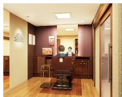
女性用ブース（イメージ図）