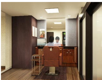
男性用ブース（イメージ図）

また、パートナー企業との共同研究など、毛髪研究から生まれた、ヘア&スカルプケア商品も豊富にラインナップしています。更に、他社でウィッグを購入したが、スタイルが合わない、カラーが合わない、メンテナンスができないなど、お悩みの方にもアフターメンテナンスを実施しておりますので、お気軽にご相談いただけます。