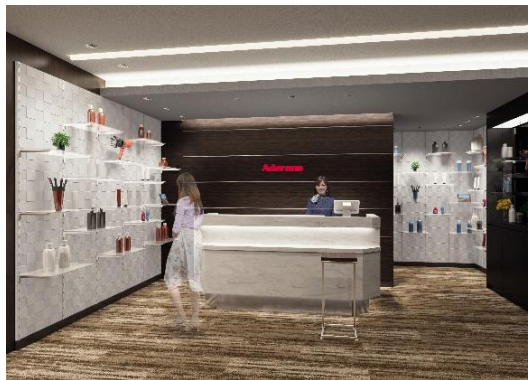
エントランス（イメージ図）

今回移転リニューアルする「アデランス富山」は JR「富山」駅南口、富山地方鉄道「電鉄富山」駅から徒歩 3 分ほどの利便性に富んでいる好立地に位置しています。エントランスに、シャンプーやトリートメント等のヘアケア商品を展示するディスプレイスペースを設けたことで、お客様に商品を手に取って触れていただける機会を創出しました。また、個室のブースを男性用 3 室、女性用 3 室をご用意し、プライバシーにも配慮した作りになっています。各ブースには 22 型 TV を、カウンセリングルームには、頭皮の状態をチェックし、お客様にご覧いただきやすいよう大型モニターを設置しました。専門のヘアスタイリストがお客様の魅力を最大限に引き出すオーダーメイド・ウィッグや増毛、育毛などトータルケアをお手伝いします。