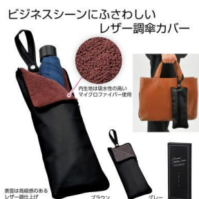
レザー調傘カバー

リニューアルオープンにあたり、ご来店のお客様に記念品をご用意いたしました。ご来店時にDMをご持参されたお客様のうち、先着260名様に『フォーマル傘カバー』または『moz スウェーデンカラーエコバッグ』のどちらかをプレゼントいたします。※数に限りがございますので、なくなり次第終了とさせていただきます。※お一人様、一つまでとさせていただきます。