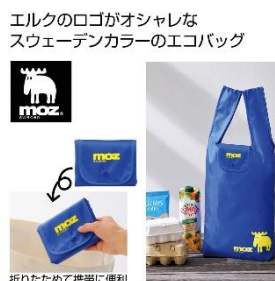
スウェーデンカラーのエコバッグ