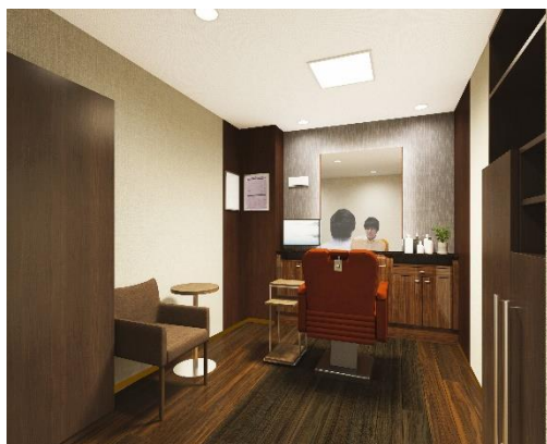
「アデランス松本」男性用ブース

店内には、周囲を気にせずにリラックスしてご利用いただける個室のブースを男性用4室、女性用3室をご用意し、プライバシーにも配慮した作りになっています。カウンセリングルームには、頭皮の状態をチェックし、お客様にご覧いただきやすいよう大型モニターを設置しました。