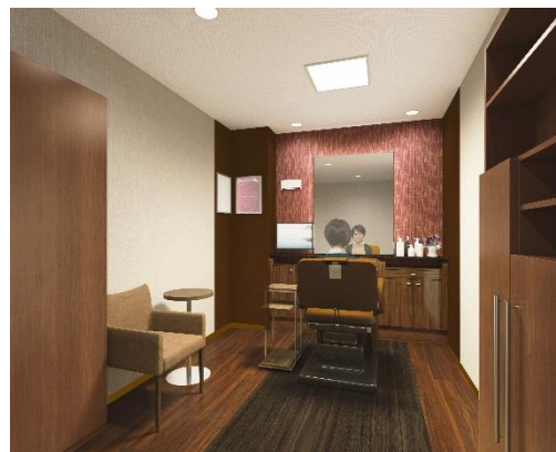
「アデランス松本」女性用ブース