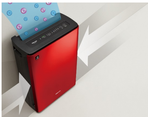
前面吸い込みと上吹き出しによる壁ピタ設置 (イメージ図)

奥行約 220mm と薄型スリムなスクウェアフォルムで、限られたスペースや狭い空間でも設置しやすい省スペース設計です。前面から空気を吸い込み、上に吹き出す構造で、電源コードは底面の三方向から引き出せるため、コンセント位置を気にせず、壁にぴったりと設置することが可能です。