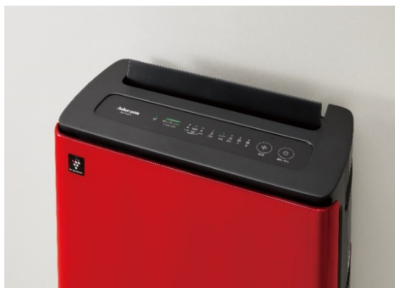
『プラズマクラスター技術搭載加湿空気清浄機』

今回発売する『プラズマクラスター技術搭載加湿空気清浄機』は、シャープ株式会社（本社：大阪府堺市、代表取締役社長 野村 勝明、以下 シャープ）の独自技術であるプラズマクラスター※1 を搭載した加湿空気清浄機です。