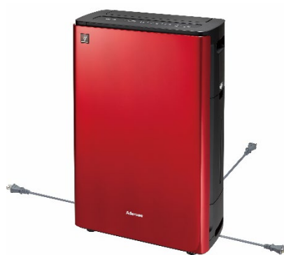
底面引き出し電源コード (イメージ図)