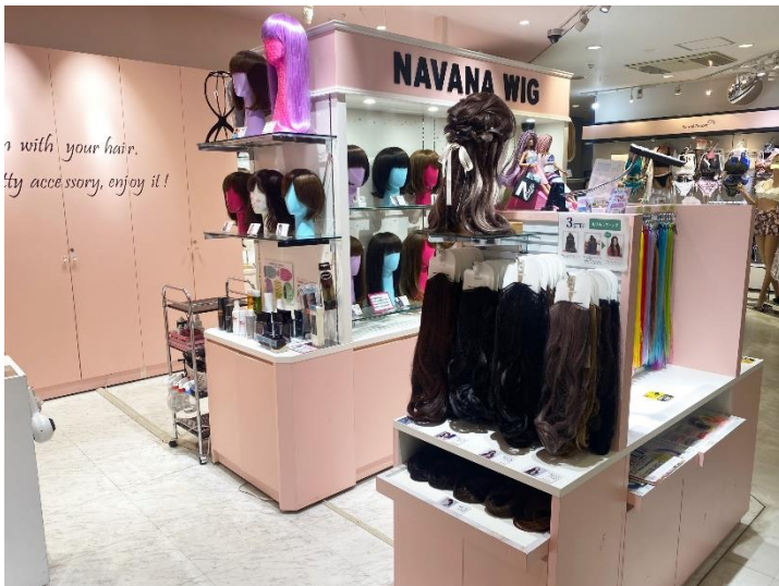
「NAVANA WIG 渋谷 109 店」