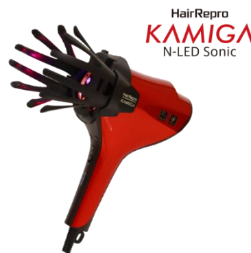
N-LED Sonic KAMIGA

『N-LED Sonic KAMIGA』は、2 つの吹出口から髪の広範囲に風を届ける速乾方式や、熱ダメージや過乾燥を抑える温度に自動調節する「センシングドライモード」などに加え、赤色 LED 光源「N-LED beam®」（エヌ エルイーディー ビーム）と、付け替え可能な当社オリジナルのかっさアタッチメント「カミガハンド」「カミガかっさ」を搭載したドライヤーです。髪を乾かす機能に加え、ご自宅でスカルプエステが楽しめる「KAMIGA モード」が搭載されている点が最大の特徴です。また、速乾方式の採用により、当社従来機（N-LED Sonic）と比べ、ドライ時間を約 50% 短縮※1。「かっさアタッチメント」で髪をかき分けながら、赤色 LED の「N-LED beam®」と青色 LED を、髪と頭皮にたっぷり届けます。