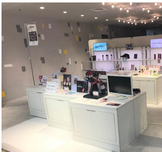
昨年の東急ハンズ池袋店でのイベントの様子

昨年、8 月に東急ハンズ池袋店で実施した同イベントでの反響から、今回東急ハンズ町田店 7 階イベントスペースにて特設ブースを設置します。今回は初めてとなるオーダーメイド・ウィッグや、レディメイド・ウィッグ（既製品）の展示とご試着の他、夏にもおすすめのサロン系ヘアケアグッズをご提案いたします。ブースでは、昨年 5 月に全国で発売を開始した 2 色の LED と 2 種類のかっさアタッチメントを搭載したヘアドライヤー『N-LED Sonic KAMIGA』や 4 種類の LED 光源を搭載した LED 美容照射パネル『BeauStage VIRUGA（ビューステージ ビルガ）』なども体験いただけます。その他、この時期におすすめの男性向けヘア&スカルプケア商品『HairRepro（ヘアリプロ）』シリーズ、女性向けヘア&スカルプケア商品『Benefage（ベネファージュ）』シリーズなどを多数取り揃えております。また期間中は『N-LED Sonic KAMIGA』を定価の 30% オフで販売し、ウィッグの下取りキャンペーンも実施します。様々な体験商品をご用意していますので、是非この機会にお試ください。