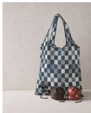
くろちく お手玉えこばっぐ（市松模様）