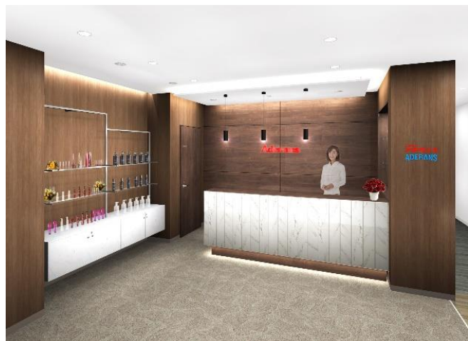
左：男性ブース、右：エントランス（イメージ図）