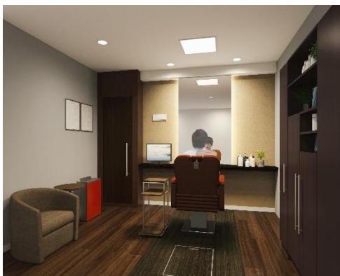
「アデランス静岡」男性用ブース