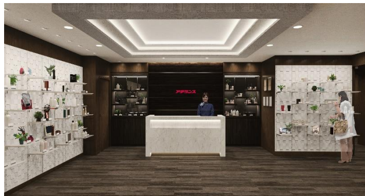
エントランス（イメージ図）

今回オープンする「アデランス静岡」は JR「静岡」駅北口から徒歩 2 分ほどの、地下直結でアクセスが可能な利便性に富む好立地に位置しています。エントランスには、シャンプーやトリートメント等のヘアケア商品、6 月 1 日に新発売した高性能小型折り畳み式ヘアドライヤー「BeauStage ELEGANJET（ビューステージ エレガンジェット）」や LED 美容照射パネル「BeauStage VIRUGA（ビューステージ ビルガ）」などを展示する大型のディスプレイスペースを設けたことで、お客様に商品を手に取って触れていただける機会を創出しました。大型のディスプレイスペースは、今回で 6 店舗目の導入となります。個室のブースを男性用 5 室、女性用 5 室ご用意し、プライバシーにも配慮した作りになっています。カウンセリングルームには、頭皮の状態をチェックし、お客様にご覧いただきやすいよう大型モニターを設置しました。専門のヘアスタイリストがお客様の魅力を最大限に引き出すオーダーメイド・ウィッグや増毛、育毛などトータルケアをお手伝いします。