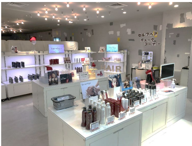
特設ブースの様子

そこで、今回東急ハンズ池袋店 2 階ヘアケアコーナーに特設ブースを設置し、夏にもオススメのサロン系ヘアケアグッズをご提案いたします。ブースでは、今年 5 月 20 日（木）に全国で発売を開始した 2 色の LED と 2 種類のかっさアタッチメントを搭載したヘアドライヤー『N-LED Sonic KAMIGA（エヌ エルイーディー ソニック カミガ）』やサロンでのハンドテクニックを参考に開発したスカルプ&ビューティケア機器『バスタイムエステ スパニスト』等を体験いただけます。その他、この時期にオススメの男性向けヘア&スカルプケア商品『HairRepro（ヘアリプロ）』、女性向けヘア&スカルプケア商品『Benefage（ベネファージュ）』、スプレータイプの UV ケア商品『ビューステージ UV プロテクト プレミアム sp』等を多数取り揃えております。様々な体験商品をご用意していますので、是非この機会にお試しください。