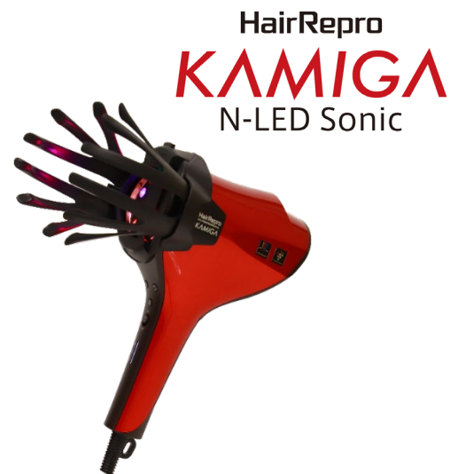
N-LED Sonic KAMIGA