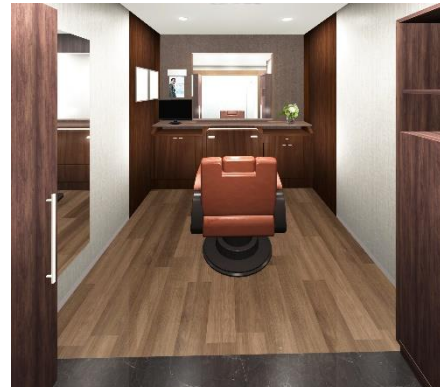
左：エントランス、右：男性ブース（イメージ図）