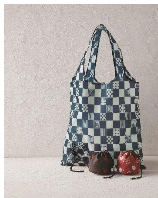
くろちく お手玉えこぼっぐ（市松模様）