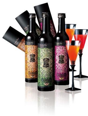
ハーブザイム®113 グランプロ シリーズ