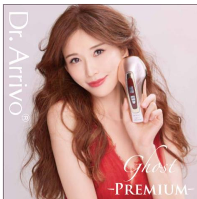
Dr.Arrivo Ghost PREMIUM

『ビューステージ青山通り』では、当社が開発した「N-LED beam®」を搭載したヘアドライヤー「N-LED Sonic（エヌ エルイーディー ソニック）」、ARTISTIC&CO.の進化を遂げた『MFIP®モード』を搭載した最新美顔器「Dr.Arrivo Ghost PREMIUM（ドクターアリヴォ ゴーストプレミアム）」や、「エステプロ・ラボ」の113種類の植物発酵液を98%配合した目的別酵素飲料「ハーブザイム®113 グランプロ シリーズ」といったトータルビューティをテーマにセレクトした商品を販売します。