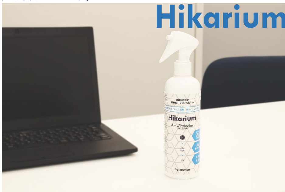
「Hikarium」ブランドロゴと光触媒コーティングスプレー（Hikarium Air iProtector）

アデランスグループでは、昨今の衛生管理に対する意識の高まりを受け、塩化ベンザルコニウム（有効成分）を配合した手指用消毒ジェル「RiBiJo」や FDA 認証（アメリカ食品医薬品局認証）及び CE マーク（欧州連合加盟国基準適合マーク）を取得した「AD フェイスシェルター」を発売し、衛生事業を強化しております。この度、国内グループ会社のパルメッセを中心に、衛生事業のさらなる拡大を目指してまいります。パルメッセの社名の由来は、仲間や友人を表す「Pal」（英語）と、見本市を意味する「Messe」（ドイツ語）を組み合わせ、PalMesse＝「仲間が寄り添い集まる場所」という意味を込めており、新型コロナウイルスの早期終息を願い、再び人々が集まれる環境づくりに貢献したいという思いから、SDGs 活動の一貫としても位置付けております。また、光触媒関連サービス・商品の総称として、「Hikarium（ヒカリウム）」という新ブランドを立ち上げ、アデランスグループの事業領域である理美容室・エステサロンをはじめ、飲食店、病院等への衛生サービスを展開し、アデランス店舗及びアデランス公式通販サイト（ http://www.aderans-shop.jp/ ）等にて、光触媒コーティングスプレー（Hikarium Air iProtector）を販売いたします。