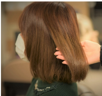
エミスイート アシッドテクスチャートリートメント施術前

スタンダードな酸熱トリートメントに加え、前処理剤も豊富に取り揃えています。一般的なパーマ剤に使用されるアルカリ剤不使用のパーマ剤と一緒に使用し、多少のクセや広がりも抑えるためハイブリッド酸熱トリートメントとしてもご使用いただけます。髪のダメージだけではなく、広がりやうねりといった髪質も気になる、そんな方におすすめです。