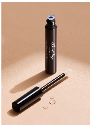
『ビューステージ アイブロウエッセンス メディケート』（医薬部外品）

第 1 弾商品となる『ビューステージ アイブロウエッセンス メディケート』は、眉の薄毛を気にされている方や眉毛を抜いたり過度に負担を与えたりしていた方など、男女問わず幅広くお使いいただける眉毛用育毛剤です。3 種の有効成分（パントテン酸カルシウム、サリチル酸、レゾルシン）を配合しており、眉の薄毛・脱毛を予防し、眉毛の毛根を保護し美しい眉を育てます。当社では、今後も様々な眉や目元周りのお悩みにアプローチできるアイケアシリーズ商品の展開を予定しております。