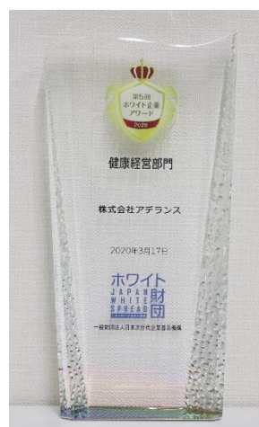
ホワイト企業認定証書(左)、経営健康部門受賞の盾(右)