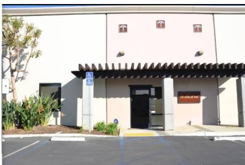
イン・ヴォーグ社外観