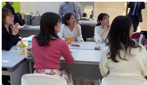
アイデア会議の様子

今回のコラボデザインは、「CURUCURU select」に会員登録している女性ゴルファーに協力いただきました。座談会では、「日焼けで頭皮が焦げたことがある」、「日焼けによる髪の毛の傷みはとても気になる」、「ゴルフを目一杯楽しみたいので、UV ケアは重要。でもダサいパッケージは持ちたくない」、「全身に使えるのは良い」など様々な意見がでました。