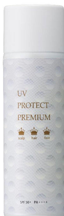
『ビューステージ UV プロテクト プレミアム sp』

そこで、紫外線リスクも高いゴルフをプレイする女性をターゲットに、女性ゴルファーの方でも手に取っていただきやすいパッケージを「CURUCURU select」とコラボしてデザインしました。今回は「CURUCURU select」に会員登録している女性ゴルファーを集めた座談会を数回開催し、使いたくなるパッケージについて、意見を集めました。集まったアイデアを基に開発したパッケージは、ゴルフボールのディンプル（くぼみ）をモチーフにしたデザインで、高級感のあるパッケージに仕上がりました。