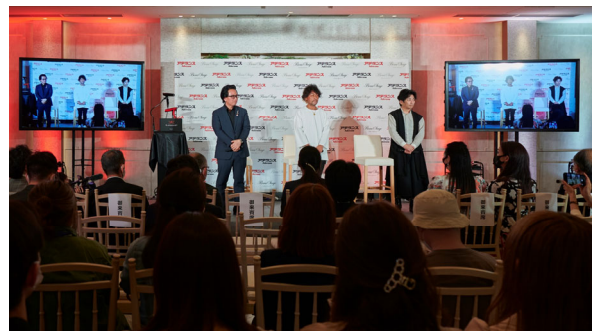
発表会会場の様子