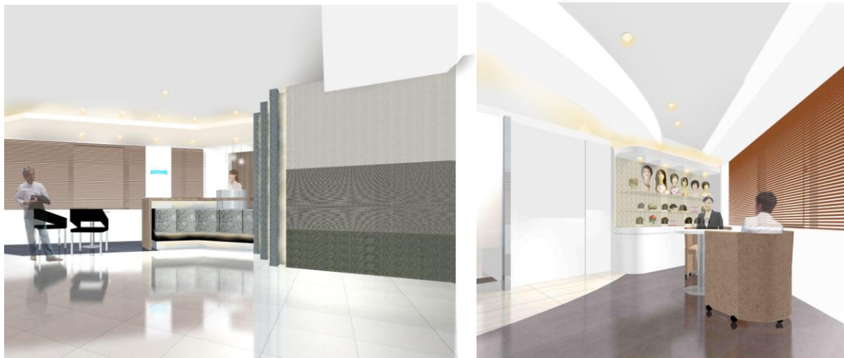
移転リニューアルする「アデランス大宮(左:アデランス 右:レディスアデランス)」(イメージ図)

リニューアルするサロンは、ビルの4階に男性サロン「アデランス」、5階に女性サロン「レディスアデランス」があり、ご夫婦でお越しになる場合も大変利便性が高くなりました。「アデランス」はモトーンを基調とした、スタイリッシュな男性をイメージした店舗づくりとなっています。「レディスアデランス」は店舗設計の新コンセプト「スタイル・ミュージアム」を取り入れており、美術館のようなオープンスペースの空間に多彩なウィッグを展示。理想のヘアスタイルをお楽しみいただけます。「アデランス」「レディスアデランス」ともにゆったりとリラックスした気分で時間を過ごしていただけるよう、プライバシーに配慮した個室にて、サービスをご提供いたします。