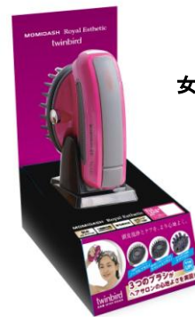
女性向け成約特典 「モミダッシュ」